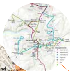
Réorganisation du réseau de transports publics collectifs - Lannion-Trégor Communauté (22) [2015 - 2017]