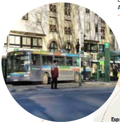
Etude de définition d'un réseau de couloirs bus à Laval (53) [2017 - en cours]