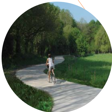
Schéma Directeur cyclable de Laval Agglomération (53) - [2016]

Itinéraire Loire à Vélo sur la Loire-Atlantique [2013 - 2014]